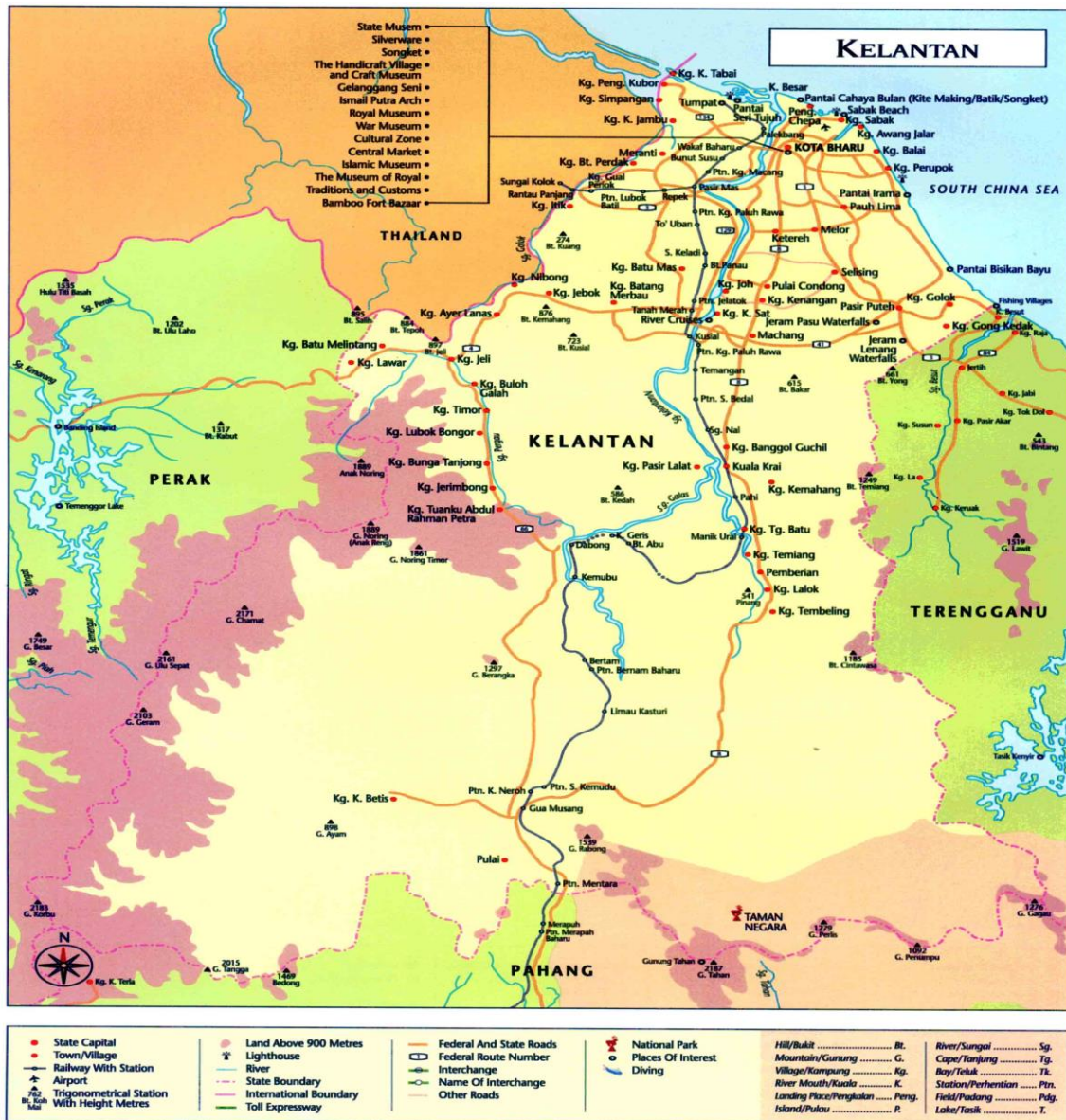
Peta 1: Sungai Kelantan