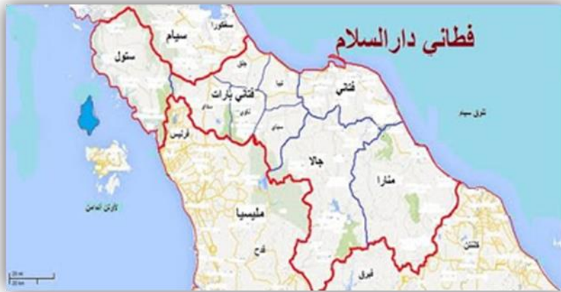
Rajah 1: Peta Patani, Thailand