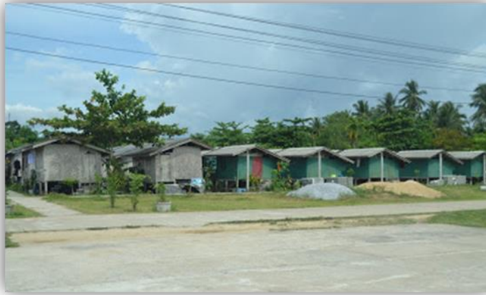
Rajah 3 : Pondok Dala Patani