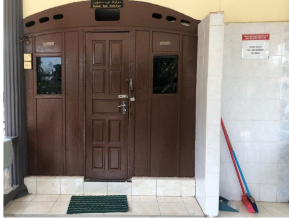
Gambar 2: Pintu Utama Suluk Tok Selehor @ Selchong