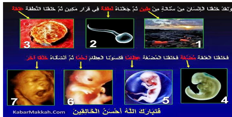
Rajah 2: Slide proses Kejadian manusia menurut al Quran.

Selain itu, konsep ini juga turut diterangkan proses kejadian manusia dalam aspek ilmu Sains.