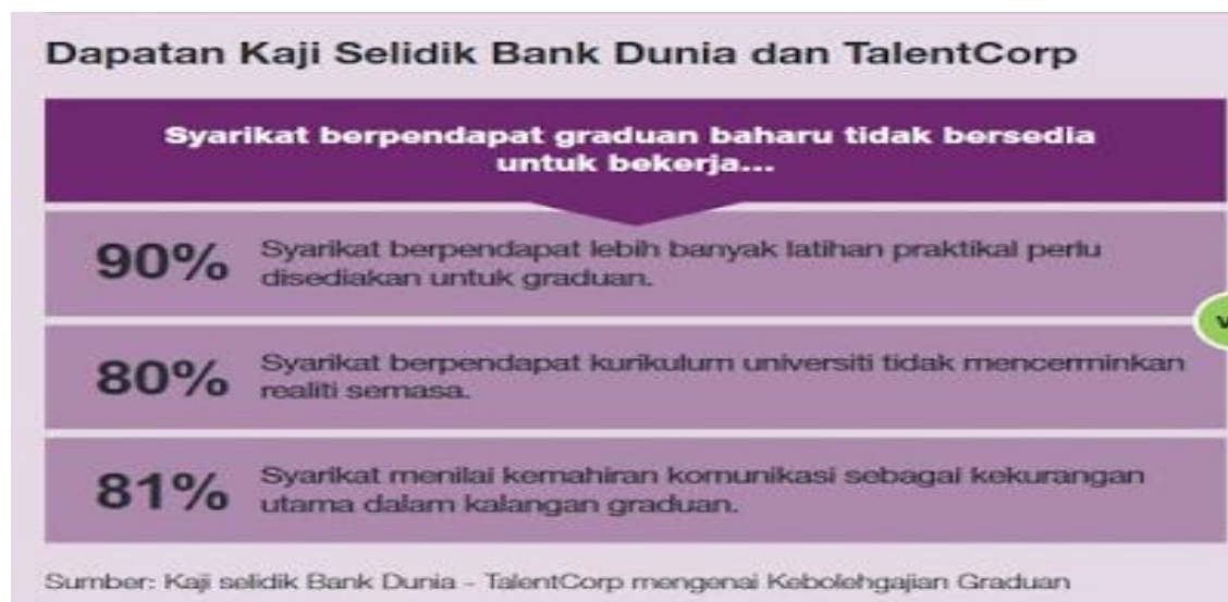
Rajah 2: Pendapat majikan terhadap persediaan graduan menghadapi alam pekerjaan.

beratkan. Hal ini dibuktikan oleh Nurul Salmi dan Mohd Isha (2014) mendapati penguasaan bertutur dalam Bahasa Inggeris dalam kalangan para graduan berada pada tahap yang rendah. Walaupun penggunaan teknologi semakin menular di setiap pelusuk dunia, namun kemahiran bertutur dengan fasih sesama manusia merupakan satu elemen yang amat penting dalam mengukuhkan sesuatu jambatan perhubungan. Sebagai contoh, pihak pemasaran tidak mampu untuk menarik perhatian para pembeli sekiranya mereka tidak berkomunikasi dengan penuh keyakinan terhadap produk-produk yang ingin mereka pasarkan. Setiap gerak-geri serta lenggok bahasa yang sesuai perlulah diambil kira dalam menterjemahkan kebaikan serta kehebatan produk yang mereka miliki demi mendapat pulangan yang lumayan kepada keuntungan syarikat.