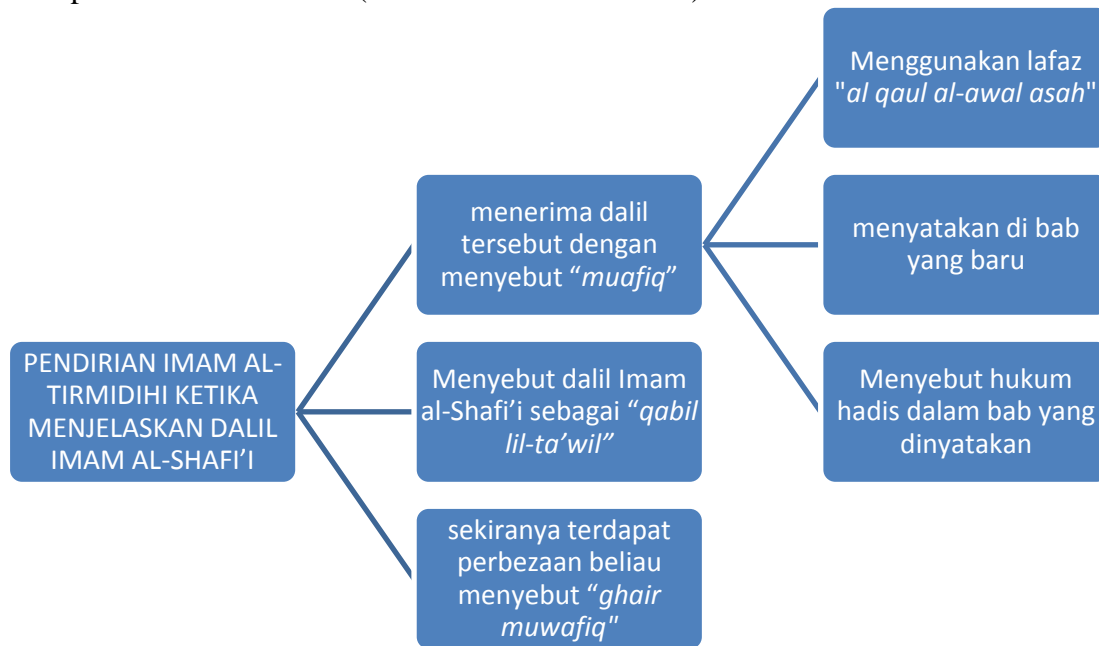
Rajah 2: Pendirian Imam al-Tirmidhi di dalam menjelaskan dalil Imam al-Shafi'i

Hadis yang dinilai oleh Imam al-Tirmidhi ini juga dikeluarkan oleh Imam Muslim di dalam Sahihnya . Dalam Sahih al-Bukhari juga disebut bahawa alhamdulillah rabbil al-amin merupakan sab al-mathani ( al-Mubarakfuri 2001 :52).