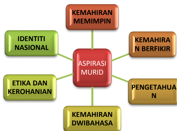
Rajah 3: Enam Aspirasi Murid.

Selain keberhasilan aspirasi sistem pendidikan, PPPM 2013 – 2025 telah membina enam ciri utama aspirasi murid yang dikatakan amat perlu dalam pendidikan berprestasi tinggi bagi membolehkan menerajui pembangunan ekonomi dan dunia global masa hadapan. Enam ciri-ciri utama tersebut ialah pengetahuan, kemahiran berfikir, kemahiran memimpin, kemahiran dwibahasa, etika dan kerohanian, dan identiti nasional (Lihat Rajah 3).