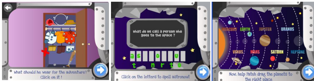
Rajah 4: Contoh skrin halangan pengembaraan angkasa

Elemen penting dalam permainan pengembaraan adalah halangan atau masalah yang perlu diselesaikan untuk meneruskan permainan atau mencapai matlamat pembelajaran yang telah ditentukan. Rajah 4 menunjukkan contoh skrin halangan.