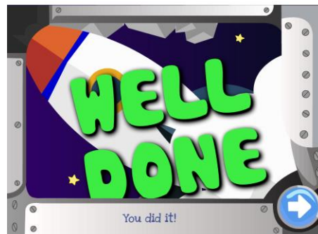
Rajah 5: Contoh skrin maklum balas positif

Setelah berjaya menyelesaikan halangan, kanak-kanak akan diberi maklum balas positif. Teknik ini bertujuan untuk memotivasi serta membina harga diri positif. Kejayaan akan mewujudkan kepuasan dan lebih menghargai diri mereka. Rajah 5 menunjukkan skrin maklum balas positif.