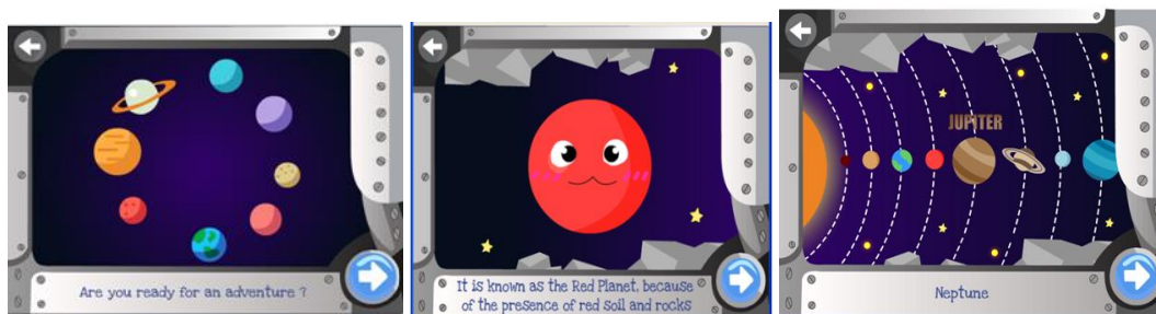
Rajah 3: Contoh skrin pengembaraan angkasa

Permainan pengembaraan biasanya mempunyai pelbagai matlamat seperti untuk mempelajari kemahiran tertentu, penyelesaian masalah, pemikiran deduktif, pengujian hipotesis dan sebagainya. Tiga ciri permainan pengembaraan iaitu mempunyai jalan cerita, halangan atau teka-teki yang perlu diselesaikan dan penjelajahan atau pengembaraan (Bronstring 2012). Rajah 3 menunjukkan contoh skrin pengembaraan angkasa yang mengandungi fakta sains dan animasi yang menarik.