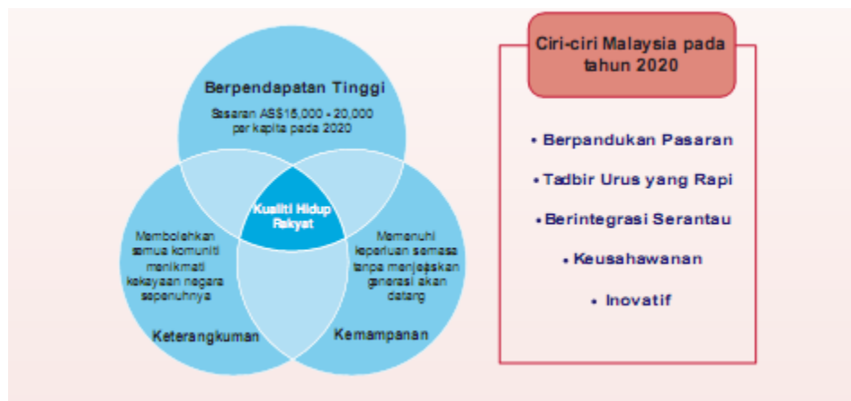
Rajah 1: Matlamat dan Ciri Model Ekonomi Baru

Cara pelaksanaan model ini terbahagi kepada 2 fasa di mana Fasa 1 bermula selepas pelancaran PTE. Sementara Fasa 2 bermula selepas pembentangan Rancangan Malaysia Ke-10 (RMK-10). Dalam perbentangan tersebut tiga prinsip utama bagi MEB telah digariskan sebagai intipati model iaitu rakyat berpendapatan tinggi, kemapanan dan keterangkuman (inklusif) . Matlamat MEB dapat digambarkan seperti Rajah 1.